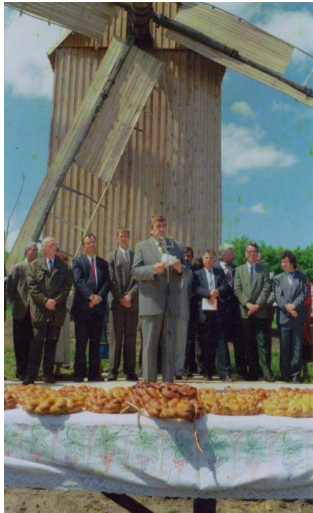
Inaugurarea primului monument de arhitectură populară în cadrul Muzeului Satului. 18 mai 1995

Muzeului Satului. Pe parcursul a patru ani au fost cercetate circa 400 de sate din toate raioanele republicii, au fost depistate și documentate cele mai reprezentative monumente de arhitectură populară. Concomitent, au fost salvate de la distrugere totală, demontate și depozitate în cadrul muzeului ultimele șase mori de vânt din secolul al XIX-lea, păstrate în unele sate, trei biserici de lemn din secolul al XVIII-lea și două case țărănești din zona arhitecturii în piatră. Investigațiile de teren au evidențiat o tendință periculoasă de dispariție a multor monumente unice drept urmare a renovării satelor. Aceste împrejurări impuneau urgentarea lucrărilor de realizare a Muzeului Satului. În baza cercetărilor întreprinse în colaborare cu Institutul de Etnografie și Folclor și Institutul de Teorie și Istorie a Artelor al A.Ș.M. a fost concretizat proiectul-concepție aprobat anterior și elaborat un program de edificare a Muzeului. Ministerul Culturii, Academia de Științe și Primăria Municipiului Chișinău au adresat un demers comun