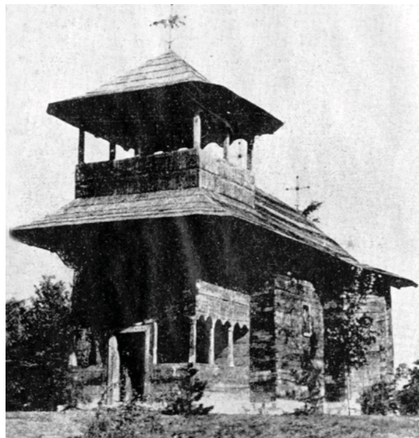
Biserica de lemn din s. Cornova, jud. Orhei, inclusă în Expoziția Dezrobirii. Chișinău 1942