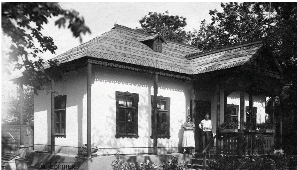
Casa cu arhitectură tradițională din zona Codrilor basarabeni, expusă în cadrul Expoziției Generale din 1925 de la Chișinău

A contribuit la conturarea ideii creării unui muzeu etnografic în aer liber și Expoziția Generală și târgul de mostre, organizate în toamna anului 1925 la Chișinău. Expoziția s-a desfășurat în Palatul Sfatului Țării și pe teritoriul din împrejurimi, unde au fost amenajate numeroase pavilioane, în care au fost amplasate 21 secții ce prezentau cultura tradițională